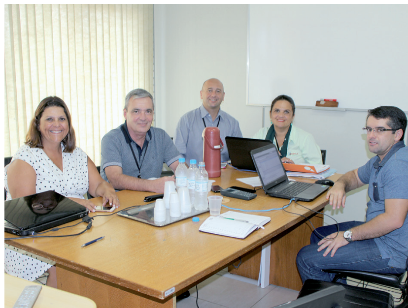
Pleito tarifário será entregue até abril

financeiros, etc. Tudo isso diz respeito à composição da tarifa da Cooperativa, então os impactos se darão diretamente na saúde econômica e financeira da CERTAJA, assim como no preço que nossos cooperados terão que pagar pelo consumo da energia distribuída. Até o final de abril a CERTAJA deve apresentar seu pleito de Revisão Tarifária à ANEEL. Para tanto, os estudos e projeções devem estar concluídos e o percentual de reajuste deve estar aprovado pelo Conselho de Administração.