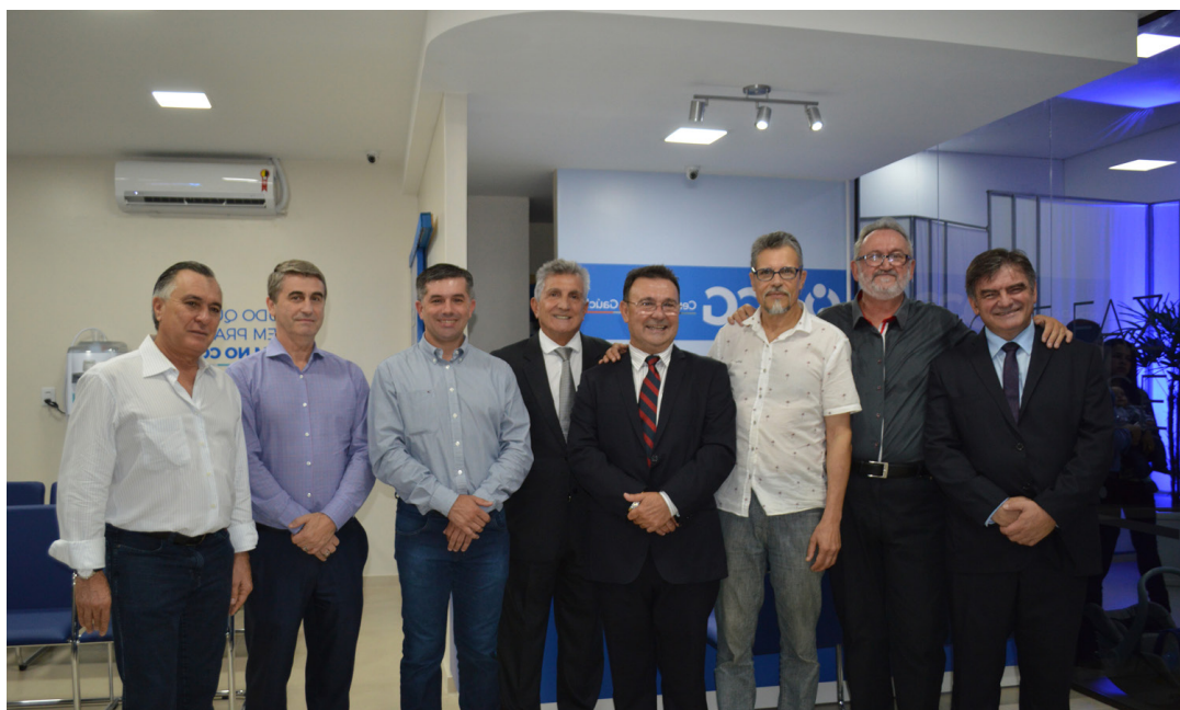
Sonho antigo: plano de saúde para funcionários e cooperados

A rede CCG, composta por outras 18 unidades próprias localizadas em Porto Alegre, Região Metropolitana e Vale dos Sinos também está à disposição dos associados da CERTAJA que aderiram aos planos.