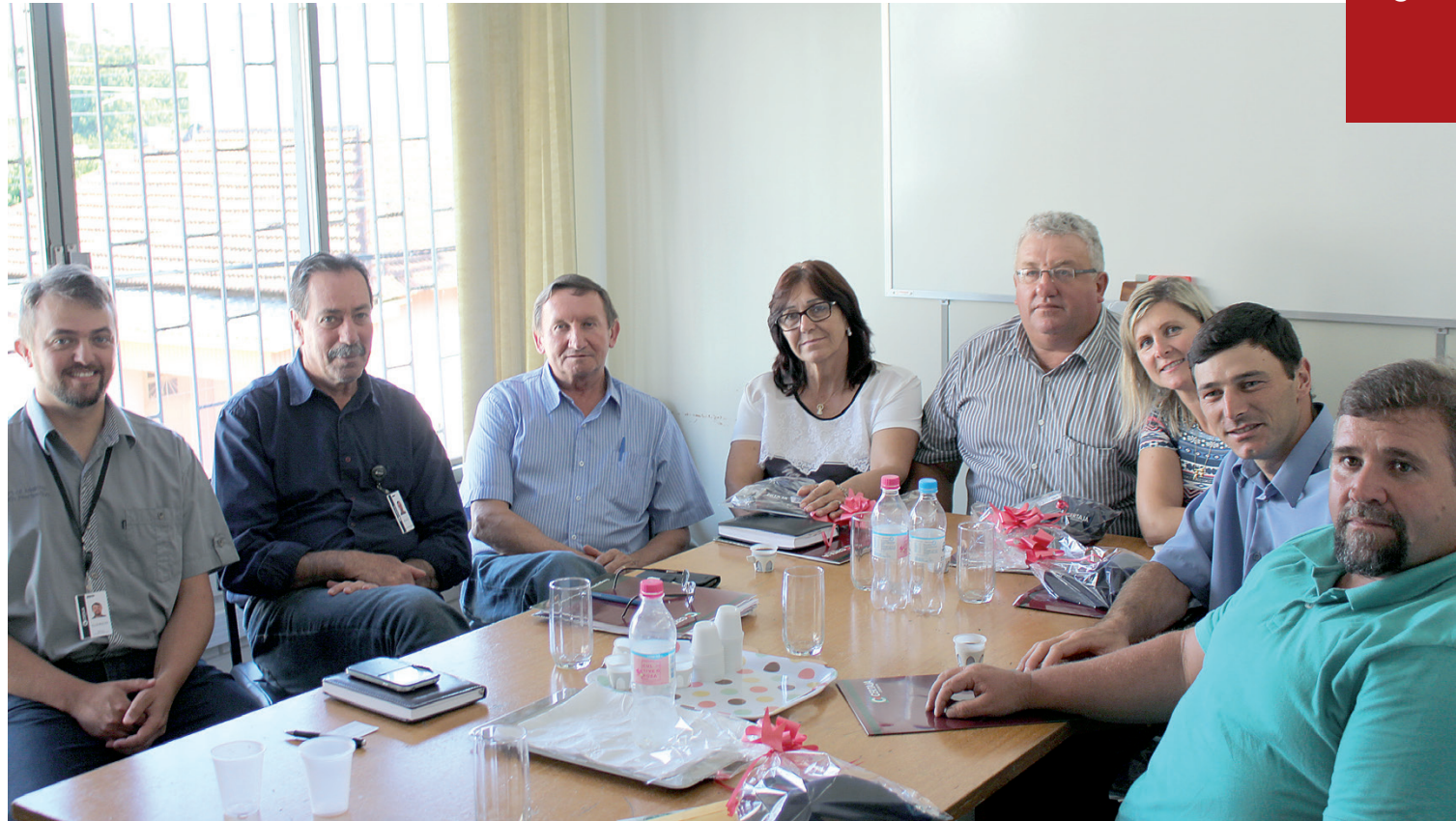
Diálogo e interesse em melhorias marcaram encontro

De acordo com os representantes baronenses, as faltas de energia elétrica se acentuaram a partir de novembro de 2016 para cá. "Ficamos sabendo que