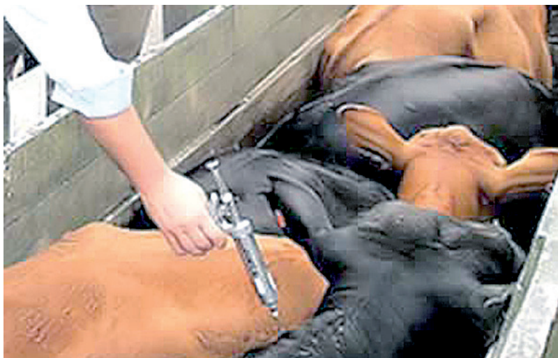
Medicamentos precisam ser usados de forma controlada